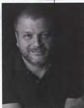
Bart Vos Vos Interieur

Vos has been responsible for prestigious projects such as the interiors of the Stadschouwburg theatre and Martini Hospital in Groningen, and many notable private interiors. He also designed the Quintal chair and the Feltz cabinet. ■